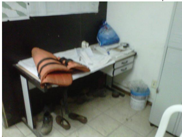
Material da Carioca Engenharia está dentro da sala da antiga COSERV, conhecida como Casa dos Artistas